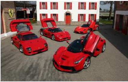
MACCHINE FERRARI PRODOTTE A MARANELLO