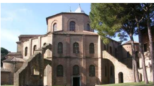
BASILICA DI SAN VITALE

RIMINI CITTÀ FONDATA DAI ROMANI E META DI VILLEGGIATURA PER TURISTI ITALIANI E STRANIERI.