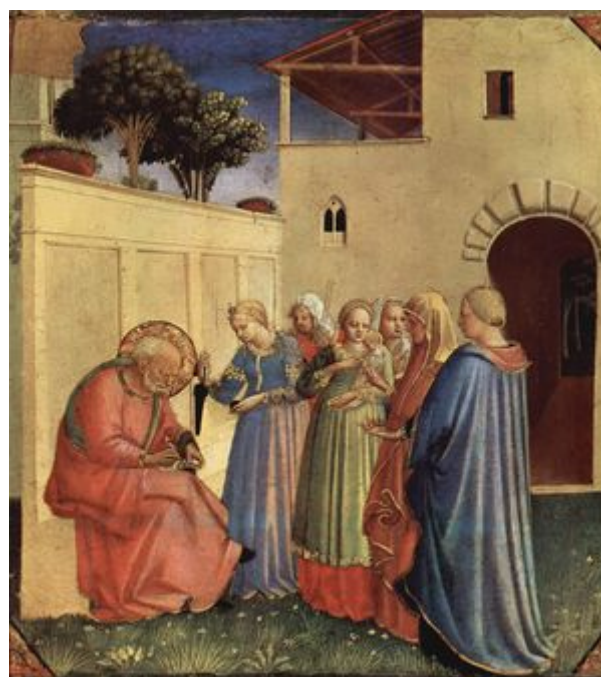
BEATO ANGELICO, Zaccaria impone il nome a san Giovanni Battista (1428 - 1430 ca.), tempera su tavola