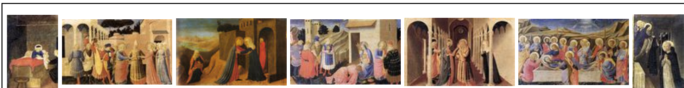
BEATO ANGELICO, Predella con Scene della vita di Maria Vergine e di san Domenico di Guzmán (1430 ca.), tempera su tavola

Il dipinto conserva anche la predella originale, in larga parte ritenuta autografa del maestro. Vi sono raffigurate cinque Storie della vita di Maria Vergine