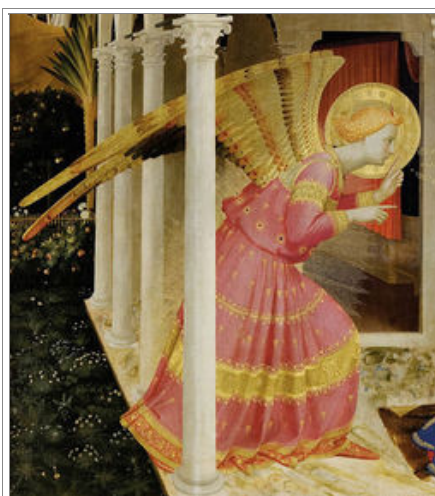
BEATO ANGELICO, Annunciazione (part. San Gabriele arcangelo annunciante ), 1430 ca., tempera su tavola

Nel dipinto sono presenti tre iscrizioni latine, che sviluppano un vero e proprio dialogo tra i due personaggi, secondo tre passi evangelici segnati in sequenza, che non rispettano l'ordine della Vulgata , ma intessono invece una singolare botta e risposta fra san Gabriele arcangelo e la Madonna, seguendo la direzione di chi le pronuncia :