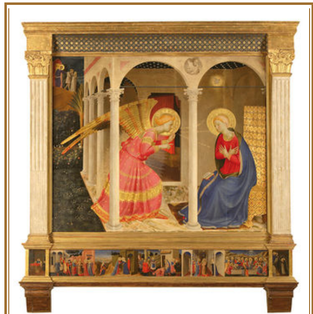
BEATO ANGELICO, Pala d'altare con Annunciazione e Storie della vita di Maria Vergine (1430 ca.), tempera su tavola

L'Annunciazione è una pala d'altare, eseguita nel 1430 circa, a tempera su tavola, dal Guido di Pietro, detto Beato Angelico, proveniente dalla Cappella dell'Annunziata nella Chiesa di San Domenico a Cortona ed oggi custodita presso il Museo Diocesano della stessa città toscana.