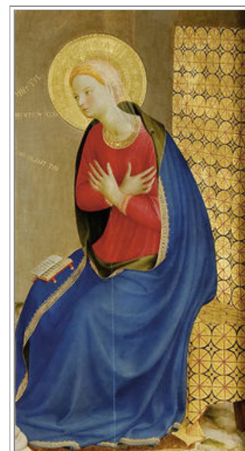
BEATO ANGELICO, Annunziatazione (part. Maria Vergine annunziata ), 1430 ca., tempera su tavola