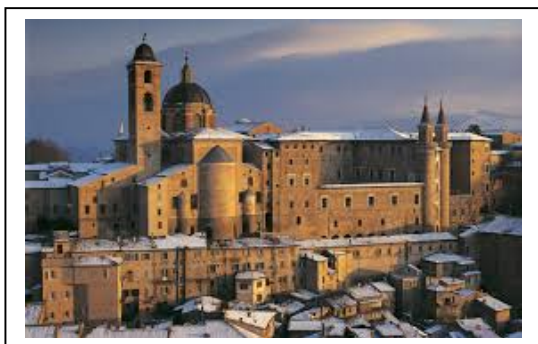
PALAZZO DUCALE DI URBINO