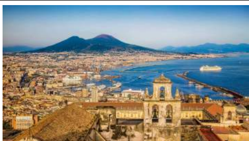
CITTÀ DI NAPOLI