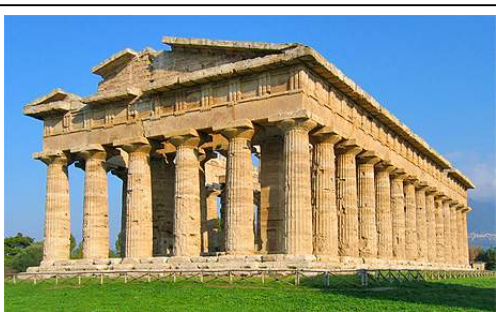
TEMPIO DI PAESTUM

POMPEI: L'ERUZIONE DEL 79 D.C. DEL VESUVIO HA RESO LE PERSONE VISIBILI SOTTO LA ROCCIA VULCANICA, SONO RIMASTE STRADE ROMANE E VILLAGGI.