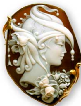
CAMMEO: PIETRA O GEMMA LAVORATA

NEI CANTIERI DI CASTELLAMMARE DI STABIA SI COSTRUISCONO NAVI, INDUSTRIE SIDERURGICHE E MECCANICHE . PORCELLANE DI CAPODIMONTE, PRODUZIONE DI PRESEPI, LAVORAZIONE DEI CORALLI E DEI CAMMEI; L'OREFICERIA DI TORRE DEL GRECO.