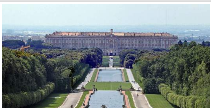
REGGIA DI CASERTA